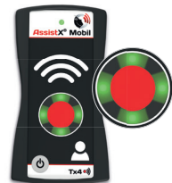
Oproepproces voltoeien Op de zender bij de beller