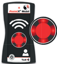
Oproep activeren Met de zender

Wanneer het oproepsignaal de ontvanger heeft bereikt (de zender licht rood op om te bevestigen dat de oproep is ontvangen), licht de ① LED op de ontvanger groen op; de zorgverlener moet de oproep nu voor de eerste keer bevestigen. Het ⑦ Bevestigingslampje en ① LED van de zender veranderen dan van rood in groen wat aangeeft dat de oproep door de zorgverlener is beantwoord. Om de oproep in de oproepwachtrij op de ontvanger te beëindigen, moet de zorgverlener de de oproep aan de beller bevestigen en via de Oproepknop op de zender binnen een instelbare tijd bevestigen.