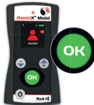
Oproep bevestigen Op de ontvanger